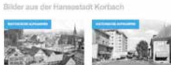
Rathaus Korbach: Bild von der Erweiterung 1978 Alteiler Landstraße, Korbach, Elektro Wilke und A...

aktuelle offerage Der "Hanseplatz" hat... 200x200px bei 72dpi 85€/Woche